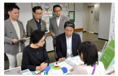
港区社協のエンディングプラン相談窓口にご相談者と

また、2025年3月予算委員会で要望の、もしもの時、どのような医療やケアを受けたいか、どのように生きたいか、家族や医療・介護従事者と話し合う人生会議(ACP:アクティブケアプランニング)シートが、ノートの一部に。